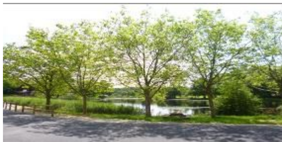
Etang aux Biches