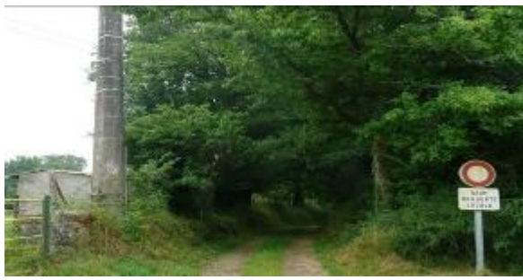
Le petit chemin

Ce chemin fait parcourir une distance de 4,2 km. Il est praticable par tous, y compris par les mamans avec enfants et poussettes. Il permet ainsi de faire découvrir certains " quartiers " de Trédion en faisant une petite balade sans grande difficulté majeure.