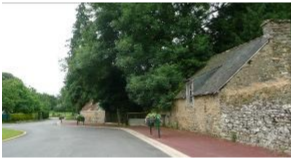
Départ de la randonnée