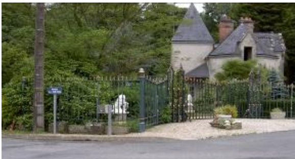
Impasse de Blénan