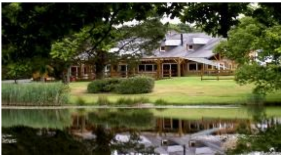
Etang aux Biches